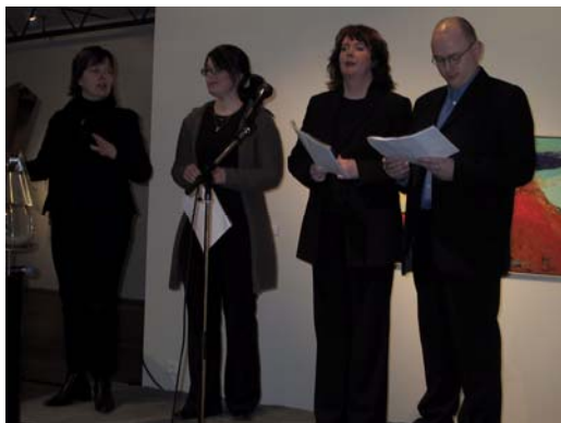
Leikfélag Keflavíkur á bókmenntakvöldi í Listasal.