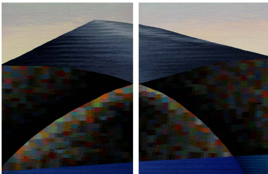
Morgunn, vefnaður eftir Ásu Ólafsdóttur