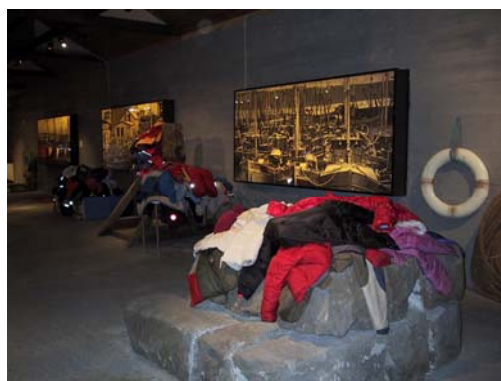
Nemendur úr Fjölbraut á sýningu Ásu Ólafs. Úlpurnar skildar eftir frammi!