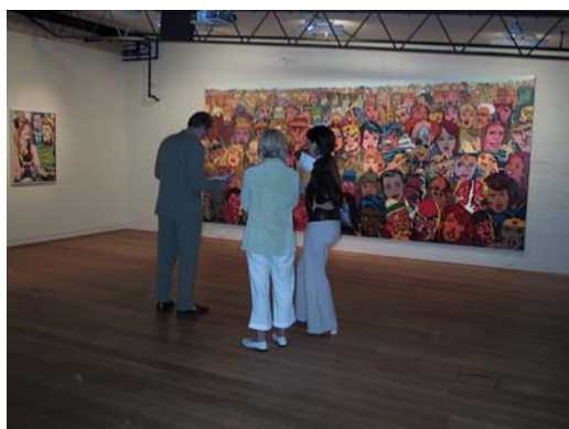
Við opnun á Erró sýningunni