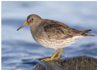
Sendlingur ( calidris maritima )

Sendlingur er algengur í grýttum fjörum og klettafjörum þar sem hann leitar að æti í þanginu, eins og þanglúsum og marflóm. Sendlingurinn er gæfur og oft hægt að komast nálægt sendlingahópum ef farið er rólega.