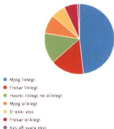
Afstaða til gróðursetningar ösku í Minningagarði