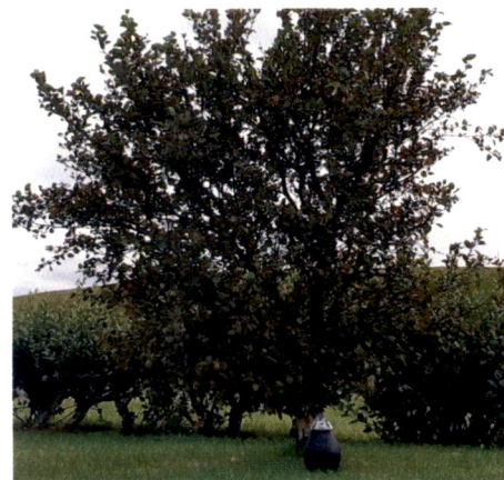
Duftiker við tré. Úr kynningarmyndbandi

Tré lífsins er frumkvöðlaverkefni í þróun og skiptist í þrjá hluta. Fyrsti hlutinn er skráning hinstu óska í persónulegan gagnagrunn, annar hlutinn er rafræn minningasíða og þriðji hlutinn bálstofa og Minningagarðar. Sá hluti sem snýr að handhöfum skipulagsvaldsins eru Minningagarðar. Í Minningagarðana verðuraska látinna einstaklinga gróðursett ásamt tré sem mun vaxa upp til minningar um hinn látna og vera merkt rafrænu minningasíðu þess sem undir því hvílir.