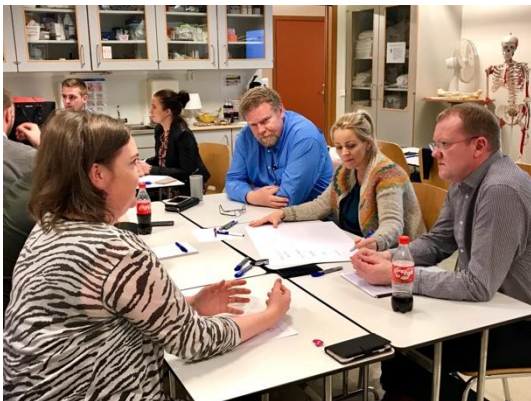
Mynd 1 Frá vinnustofu I

Á öðrum vinnufundi var farið yfir áhersluatriði og verkefni, og kortlagðar þær aðgerðir sem nauðsynlegt er að grípa til, svo stefnunni verði komið til framkvæmda.