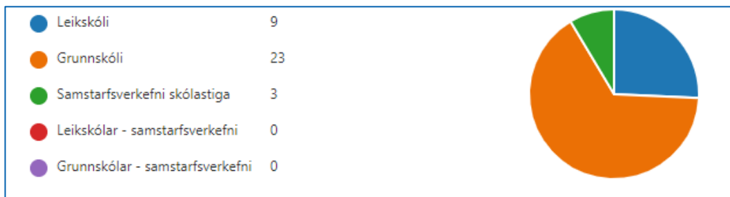
Mynd 2: Hér má sjá skiptingu umsókna

Tekið sama af grunnskólafulltrúa 11. maí 2021