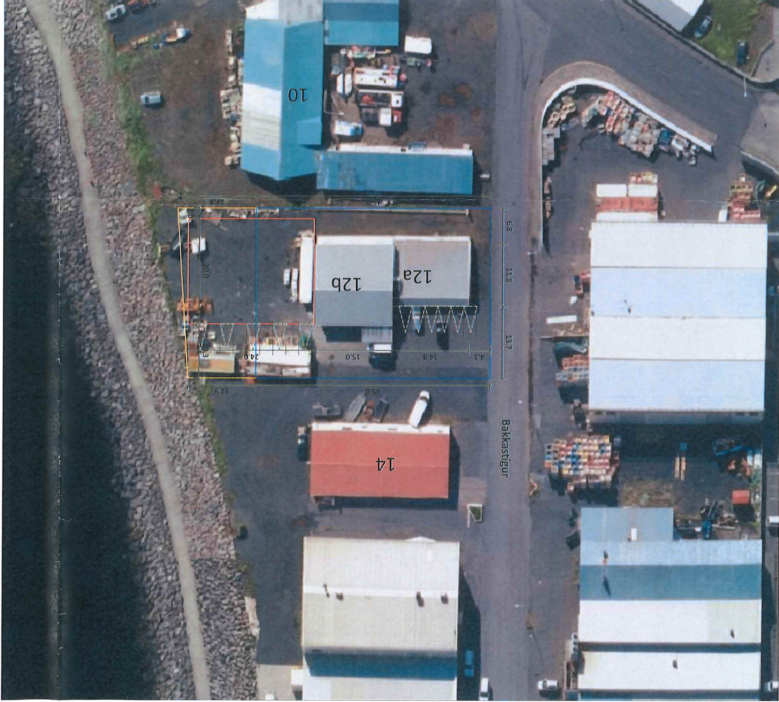
Vfirrlitsmynd Mkv. 1:500