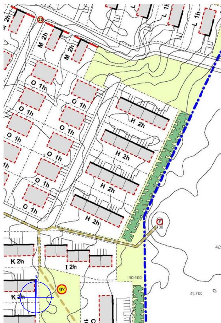
Hluti úr gildandi deiliskipulagi, Dalshverfi 2. áfangi Mkv. 1:2000