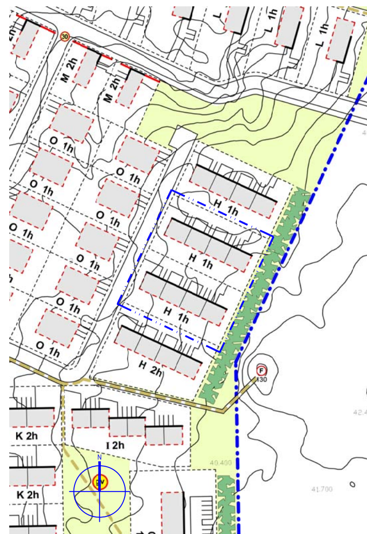
Eftir breytingu Mkv. 1:2000