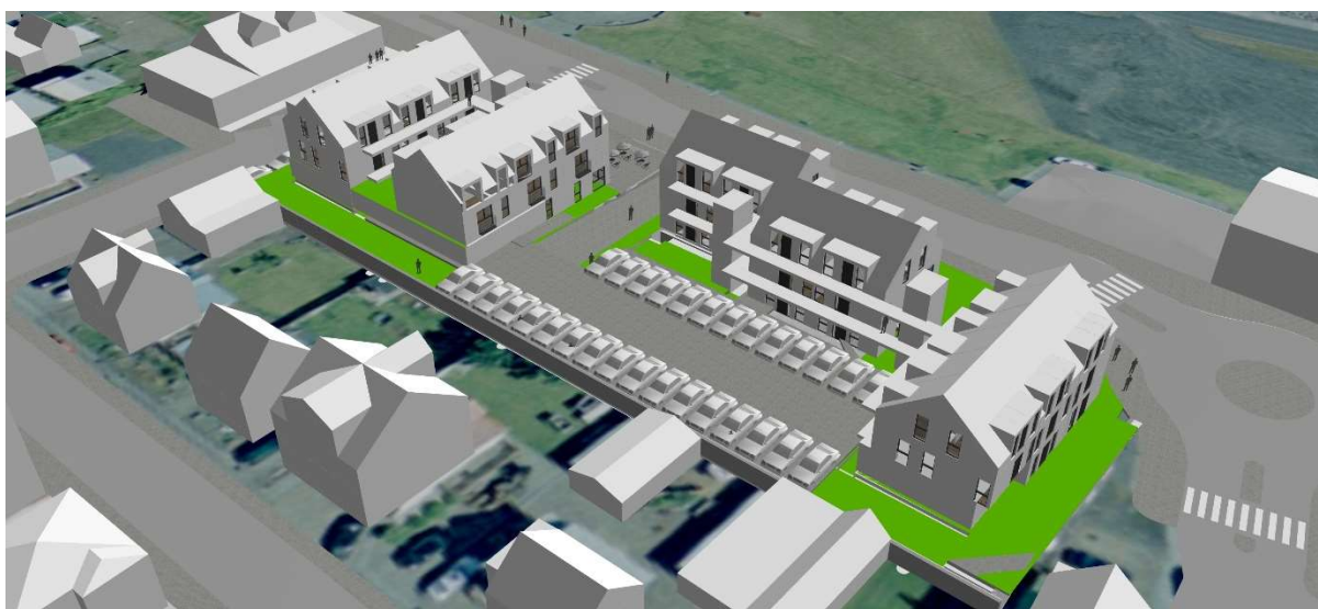
Skýringarmynd 3, tillaga að breytingu deiliskipulags, Hafnargata 12