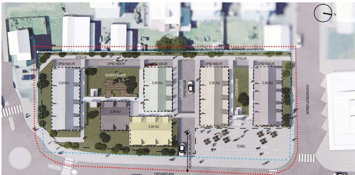
Skýringarmynd 2, gildandi deiliskipulag, Hafnargata 12