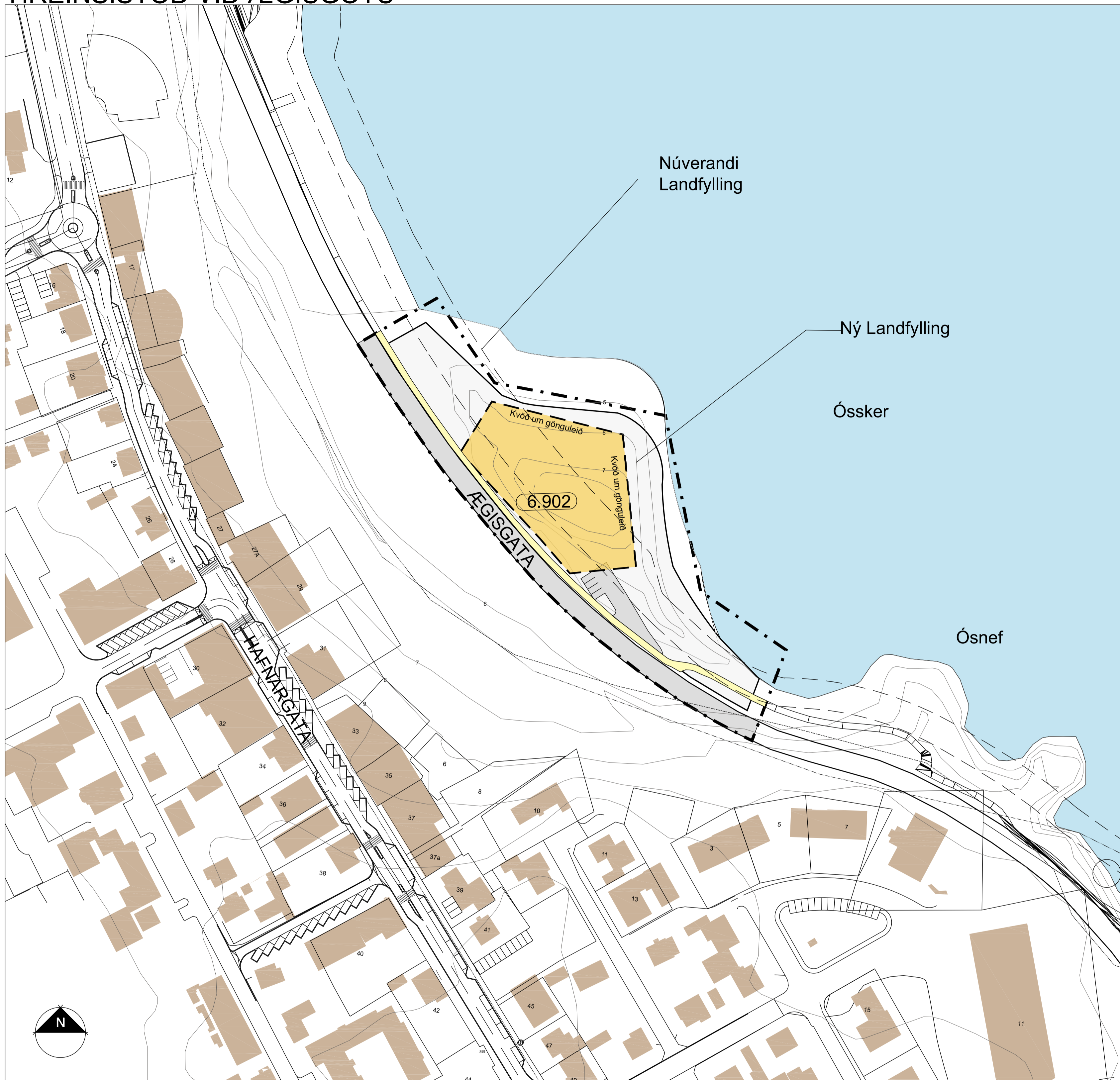
Deiliskipulagstillaga mkv. 1:1000