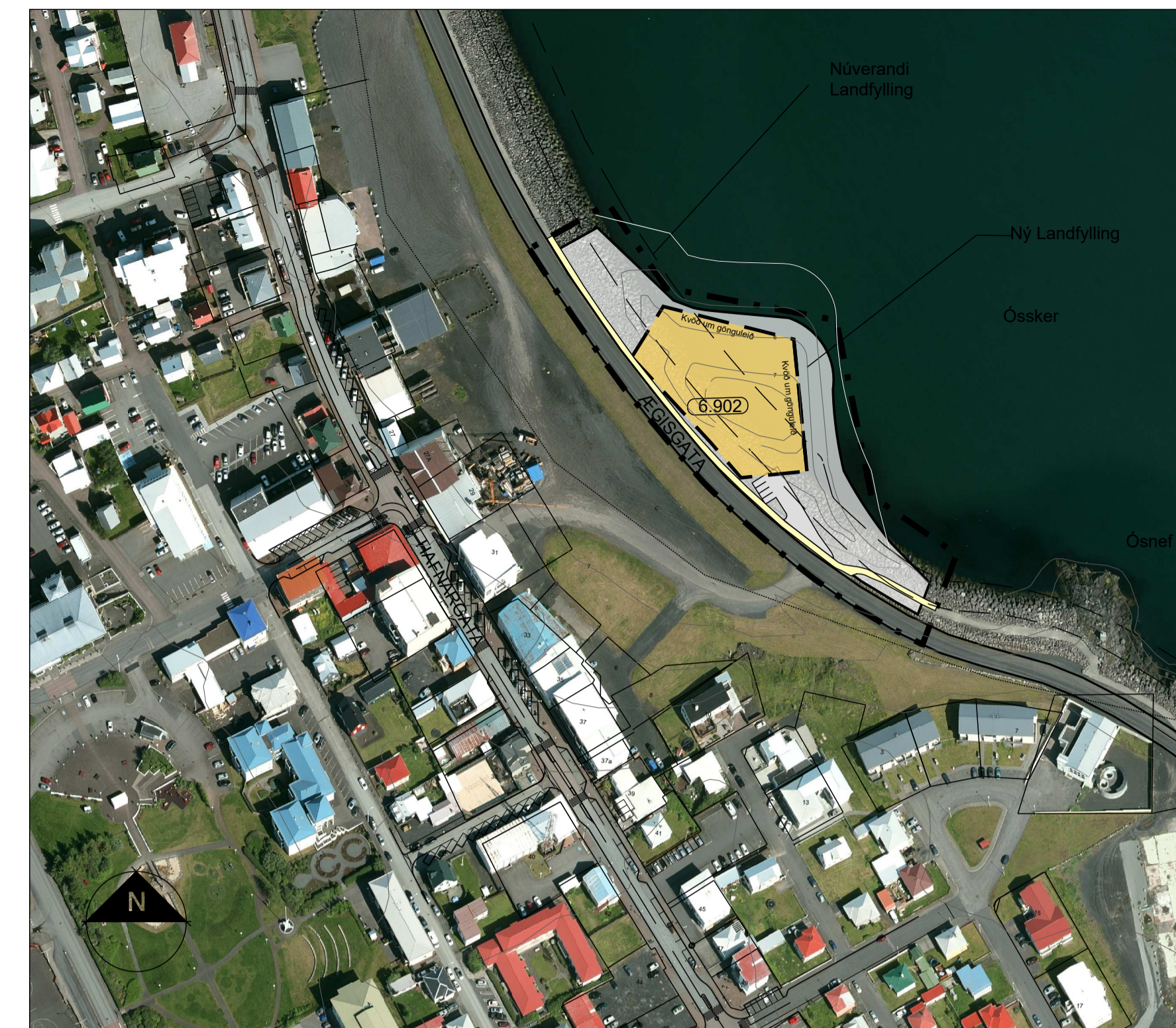
Skýringarmynd mkv. 1:2000

Eins er gerð krafa um að ekki berist hljóðmengun frá stöðinni.