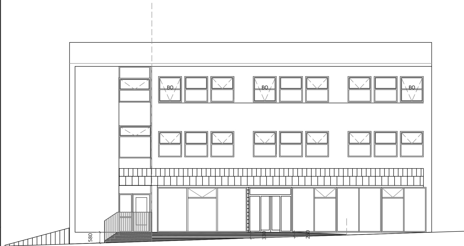
Útlit vestur - að Hafnargötu Mkv. 1:100