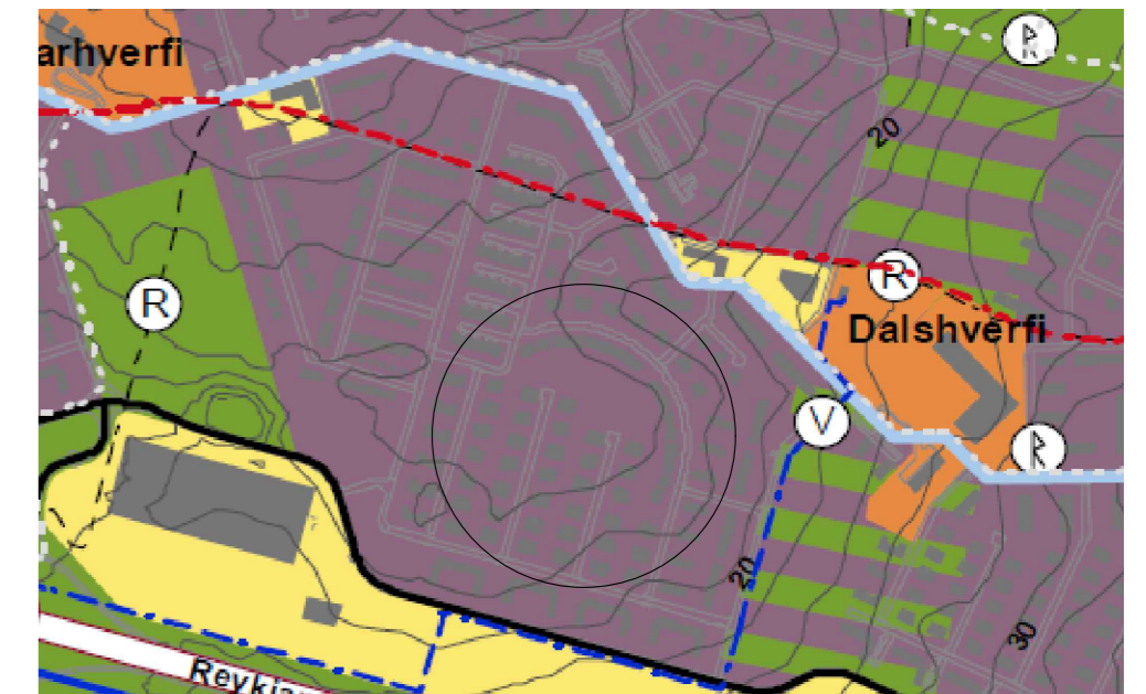
ÚR AÐALSKIPULAGI 2015-2030