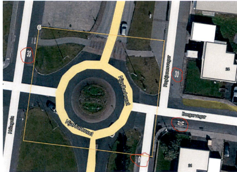
Mynd 1 - Afstöðumynd sýnir staðsetningu núverandi einnar akreinar hringtorgs og guli bletturinn framan við Borgarveg 24 sýnir þá afrein sem um ræðir. Eins og sjá má á hraðamerkingum (30) þá eru þetta íbúagötur með mikilli umferð gangandi barna og ungmenna sem sækja skóla og íþróttastarf í hverfinu. Eins má sjá að hús nr. 21 liggur mun nær núverandi hringtorgi en mín eign.