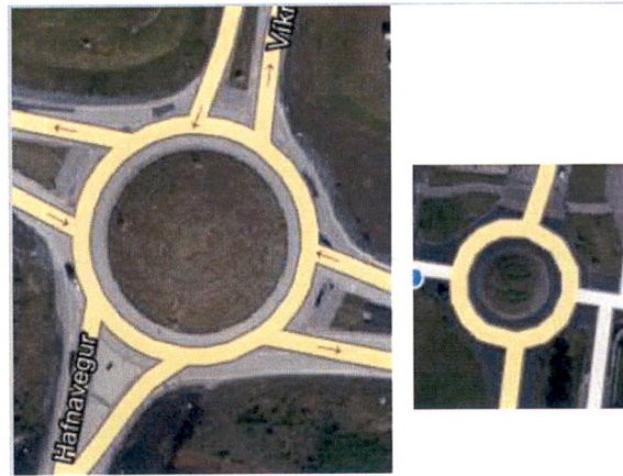
Mynd 3 – Stærðarmunur á tvöföldu hringtorgi á Fitjum og einföldu hringtorginu við Borgarveg er um fjórfaldur.