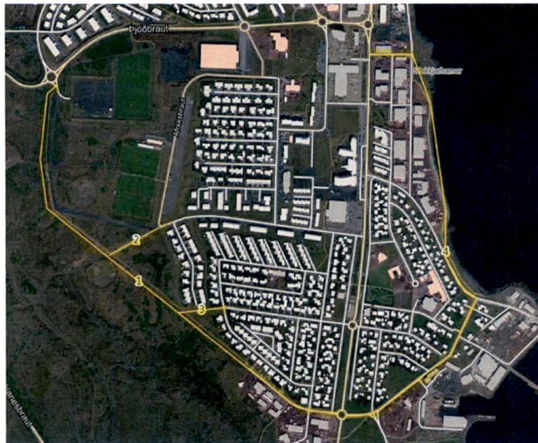
Mynd 2 – Til eru aðrar mögulegar lausnir á umferðarþunga í gegnum íbúðar- og skólahverfið heldur en aukin umferðarþungi með tvöföldu hringtorgs við Borgarveg. Sem dæmi þá mætti dreifa umferð, sem á jafnvel ekkert erindi í íbúðarbyggðina, beggja vegna meðfram hverfinu með tilheyrandi hljóðmönnum ásamt núverandi leið inn í hverfið. Þessi útfærsla dregur úr umferðarþunga í gegnum hverfið og eykur öryggi gangandi vegfarenda.