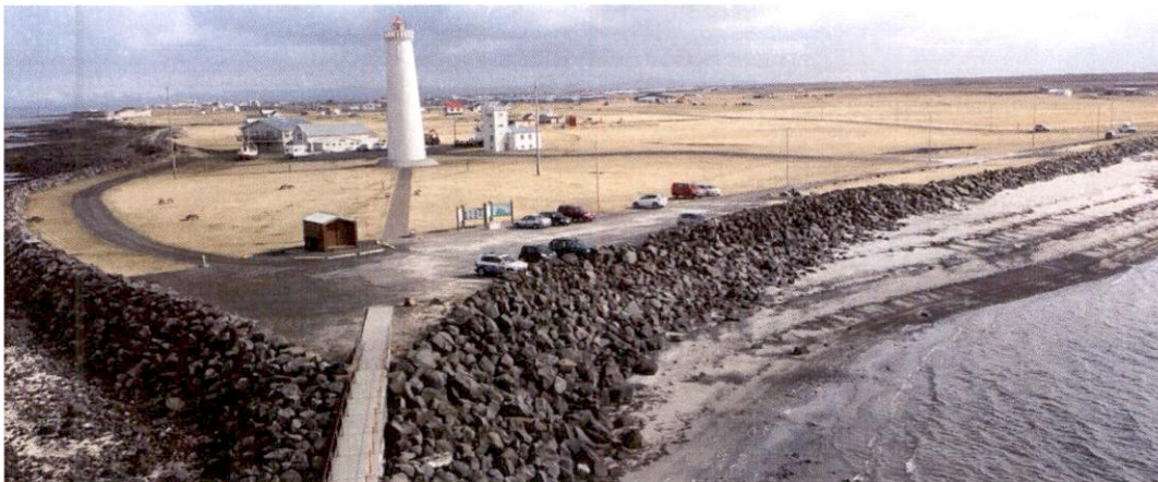
Mynd 2 Skipulagssvæðið til hægri