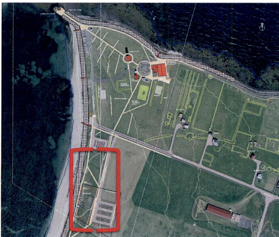
Mynd 5 Yfirlitsmynd – drög að fyrirkomulagi