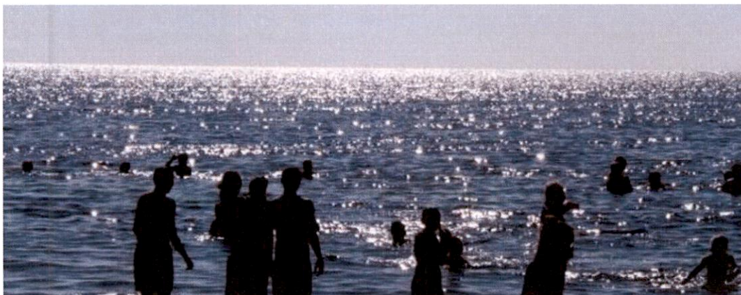
Mynd 4 Dæmi um notkun sem þarfnast aðstöðubyggingar