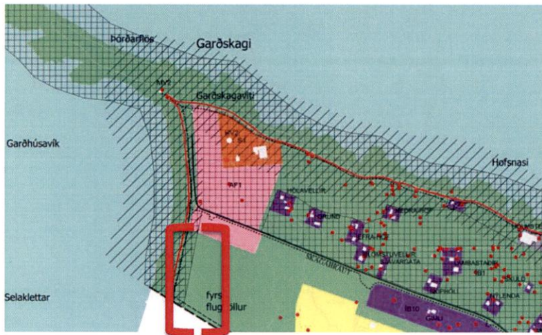
Mynd 1 Skipulagssvæðið samkvæmt nágildandi aðalskipulagi

Umrætt svæði er vestast á Garðskaga, sunnan Skagabrautar og er um 1,5 ha að stærð. Það afmarkast til vesturs af hafi, til norðurs af afþreyingar- og ferðamannasvæði við Skagabraut og austurs og suðurs er opið svæði. Aðkoma að svæðinu er frá Skagabraut. Staðurinn býr að nálægð við hafið og er víðsýnt til allra átta. Til austurs er hótél á svæði sem deiliskipulagt var árið 2015.