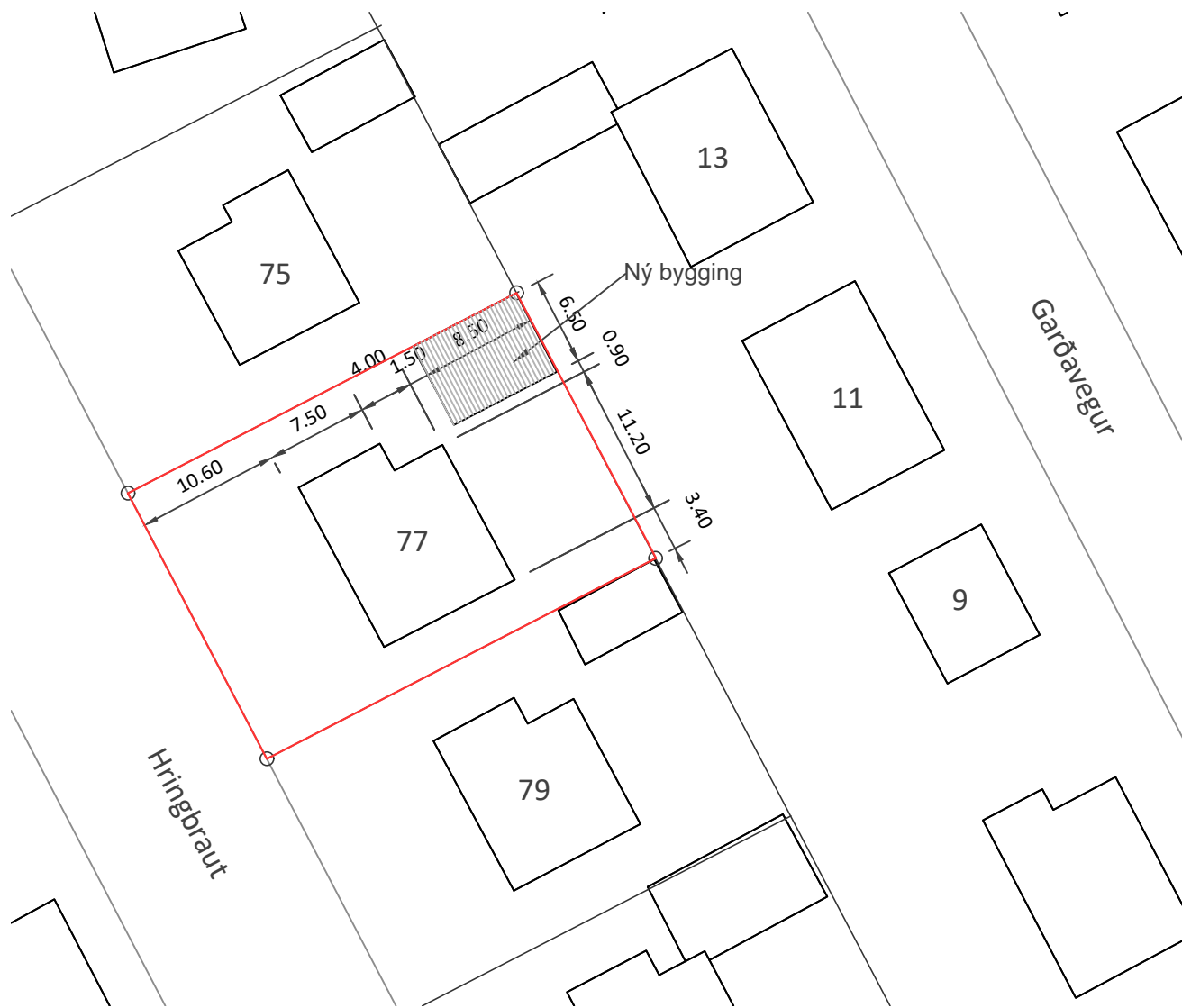
Afstöðumynd Mkv. 1:500