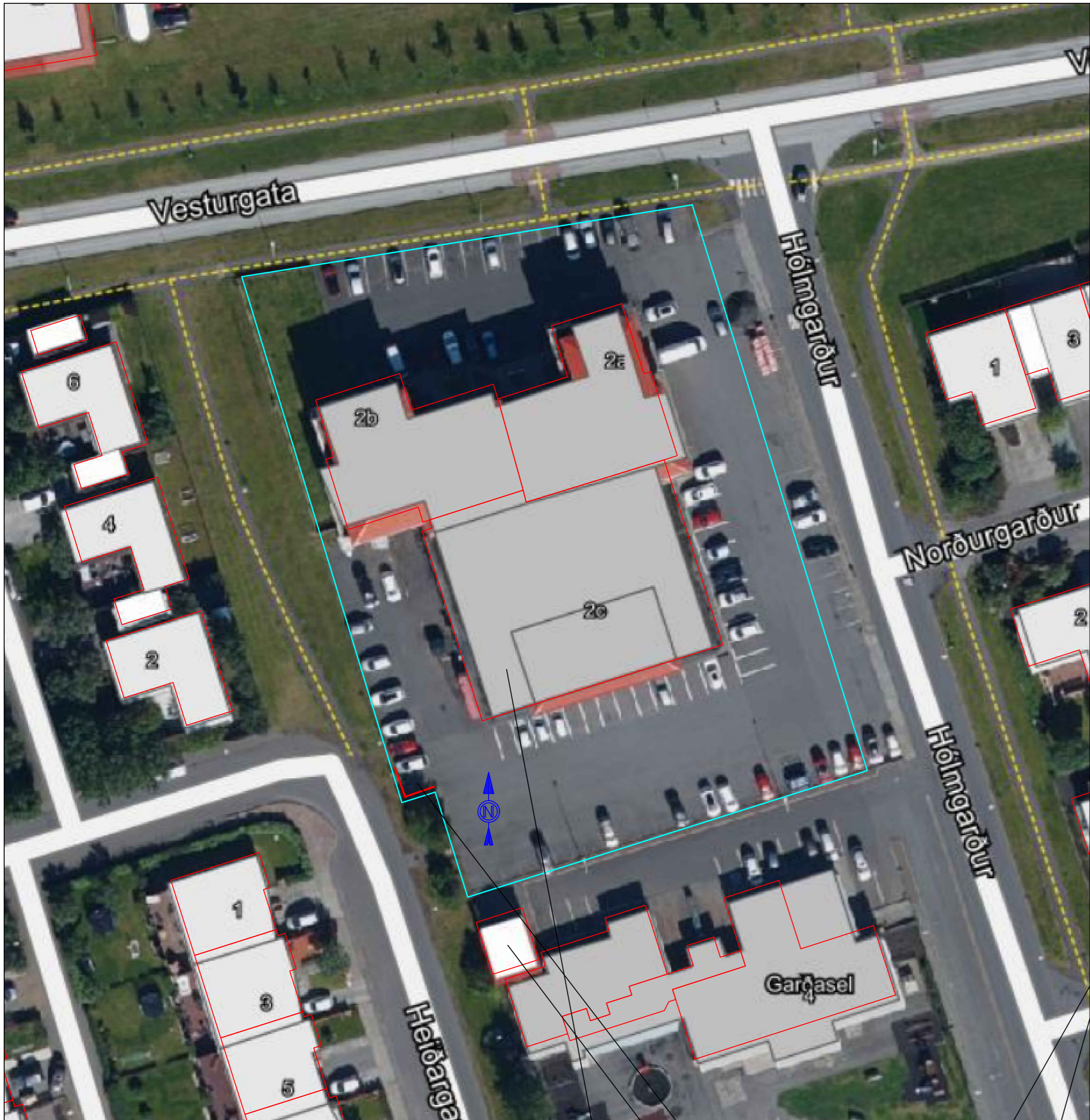
Staðsetning á skýli fyrir ruslagám á loftmynd 1:500

BYGGINGARLÝSING: ALMENN: HÓLMGARÐUR 2C, REYKJANESBÆ ER ATVINNUHÚSNÆÐI ÞAR SEM NÚ ER REKIN ÝMIS KONAR STARFSEMI S.S. BAKARÍ, FASTEIGNASALA, SJÚKRABJÁLFUN O.FL. LANDEIGNANR.: L127533. STAÐGREINIR: 2000-4-40930020. STÆRD LÓÐAR 5518 m 2 . LÓÐ ER SAMEIGINLEG MED ÍBÚÐARHÚSUM HÓLMGARÐI 2A OG 2B Á SÖMU LÓÐ. HÚSID ER STEYPT 2 - 3 HÆÐIR. ÓSKAD ER EFTIR AD FÁ AD STEYPA 2 VEGGI TIL AD MYNDA SKJÓL FYRIR RUSLAGÁM SEM NOTADUR ER Í TENGLUM VID REKSTUR BAKARIS Á 1. HÆÐ Í HÓLMGARÐI 2C. VEGGIR VÆRU REISTIR Í / VID LÓÐARMÖRK LÓÐARINNAR TIL VESTURS. HÆÐ VEGGJA ER UM 2,3 m UPP FYRIR NÚVERANDI MALBIKAD BÍLASTÆÐI. VEGGIR VÆRU STEYPTIR Á MALBIKAD BÍLASTÆÐI, 18 cm ÞYKKIR JÁRNABUNDIR OG MÁLAÐIR Í SVIPUDUM LIT OG NÚVERANDI HÚS. LENGD VEGGJA Í VINKLI ER UM 4,4 m HVOR VÆNGUR. EKKI ER ÞAK YFIR SKJÓLVEGGJUM. MEGINÁSTÆÐA FYRIR FRAMKVÆMDINNI ER AD DRAGA ÚR BRUNAHÆTTU MED ÞVI AD FÆRA RUSLAGÁM FRÁ BYGGINGUNNI. MED UMBEDINNI STAÐSETNINGU NÆST YFIR 10 m FJARLÆGD FRÁ RUSLAGÁM AD BYGGINGU.