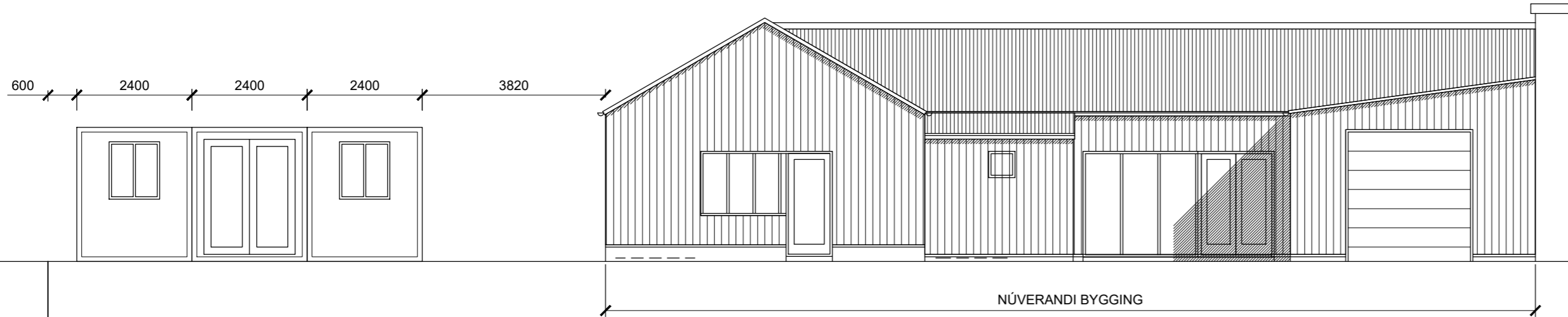
Ásýnd mkv. 1:100

Sótt er um tímabundið stöðuleyfi fyrir þremur gámum (vinnuskúrum). Gámarnir eru 2.4m x 6.0m með gluggum á framhlið. Engir gluggar eru á hlið sem snýr að húsnæði Urtu við Básveg 10.