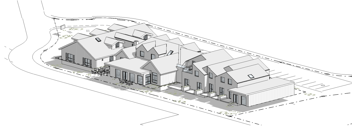
2 (00)F Yfirlitsmynd séð úr suðaustri