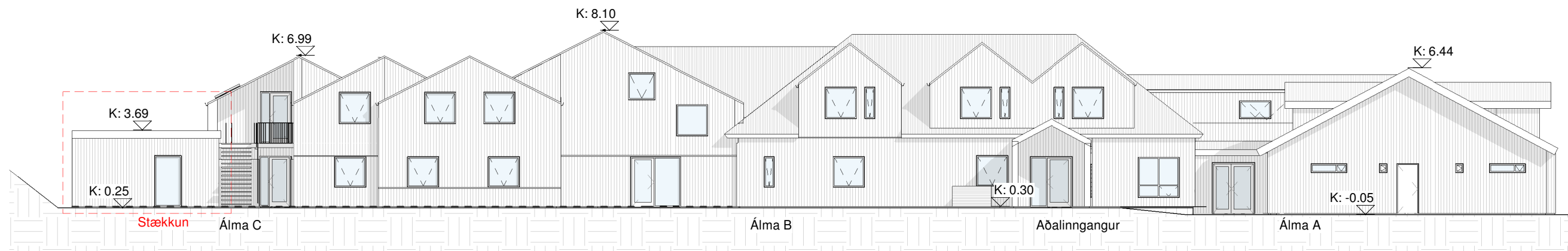
4 (00)F Ásýnd - norður 1 : 200