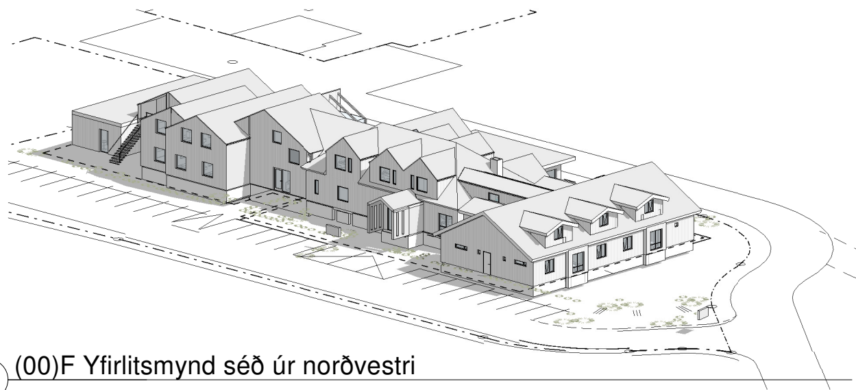
1 (00)F Yfirlitsmynd séð úr norðvestri