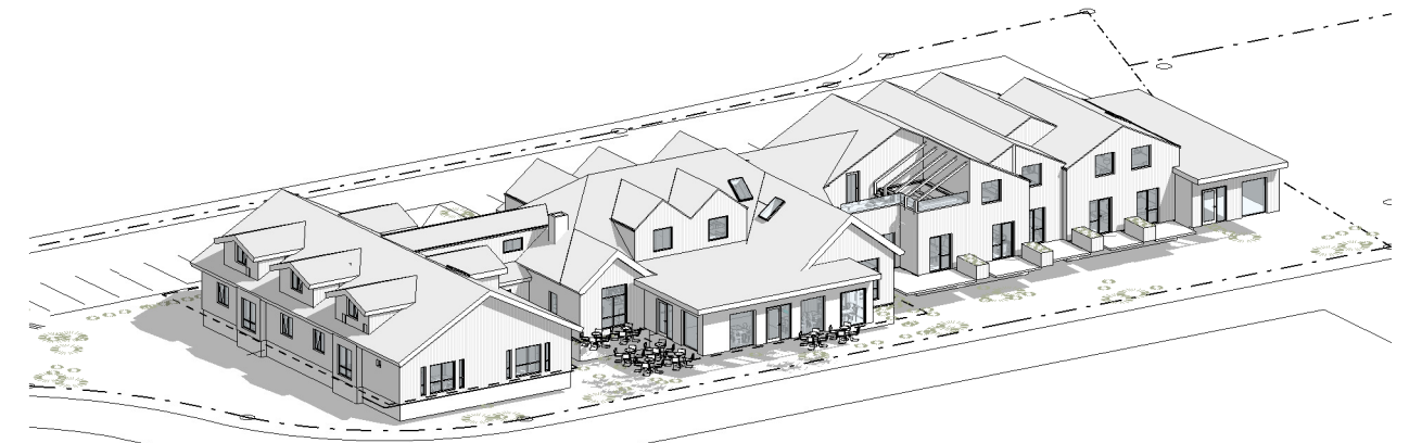
2 (00)F Yfirlitsmynd séð úr suðvestri

Skv. breytingu á deiliskipulagi 26.3.2015 er hámarksbyggingarmagn 1.629 m 2 . Sótt er um 70-100m 2 hækkun á leyfilegu byggingarmagni og stækkun á byggingarreits til austurs og að hluta til suðurs.