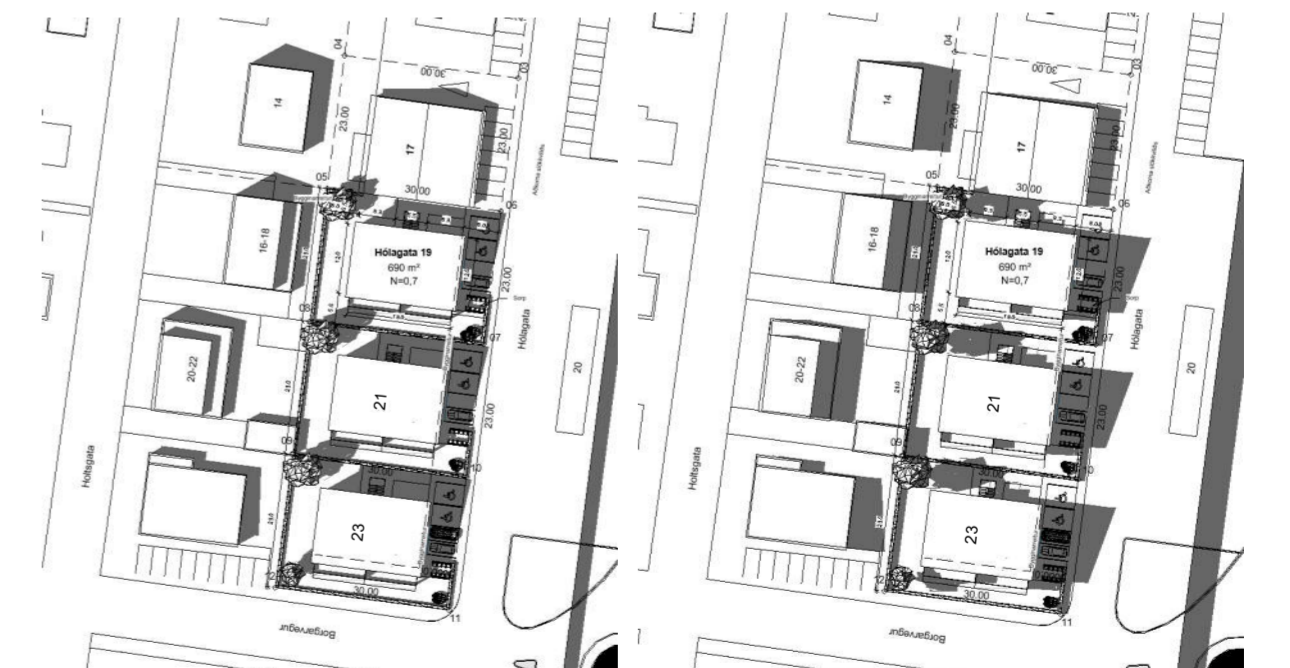
Skuggi 20.06 kl 14:00