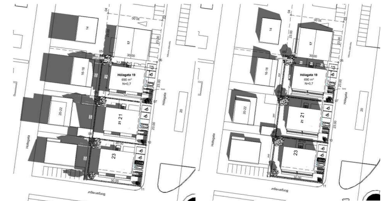
Skuggi 20.06 kl 8:00