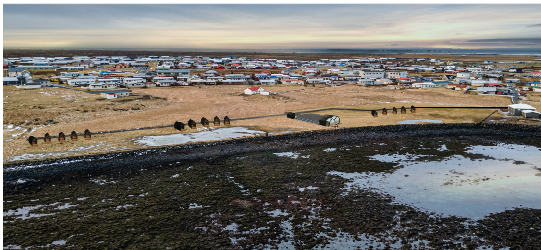
Mynd 4 Hugmynd að fyrirkomulagi gistihýsa og móttöku – og afþreyingarhúss – ásýnd til hafs