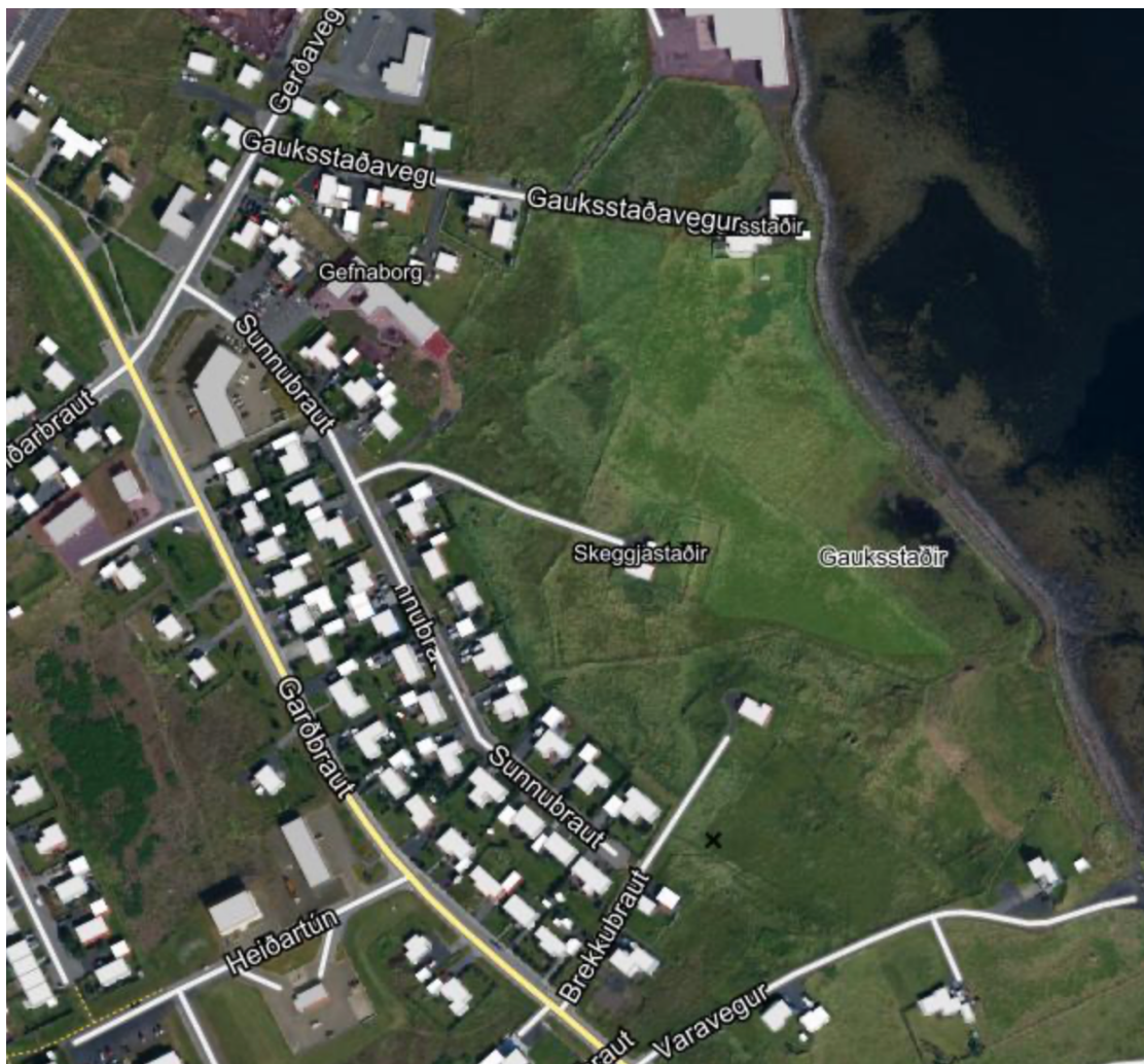
Mynd 3 Loftmynd frá svæði

Mynd úr tillögu að Aðalskipulagi Sandgerðisbæjar 2022 - 2034.