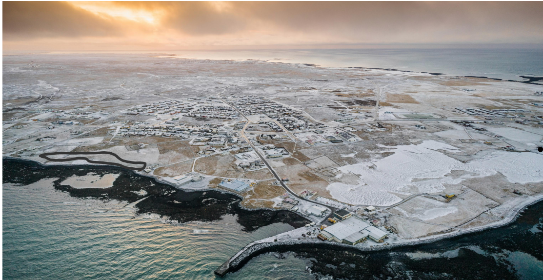
Mynd 2 Skipulagssvæðið

Umrætt svæði er í Gerðahverfi, sunnan Gauksstaða (Fasteignanúmer F2333077, staðgreinir 2510-3-99982902 ) og er 18704,0 fm að stærð. Það afmarkast til suðurs, vesturs og norðurs af skilgreindu opnu svæði og íbúðarbyggð/býlum og til austurs af hafi. Aðkoma að svæðinu er nú frá Gauksstaðaveg um Gerðaveg. Staðurinn býr að nálægð við hafið og þaðan er víðsýnt.