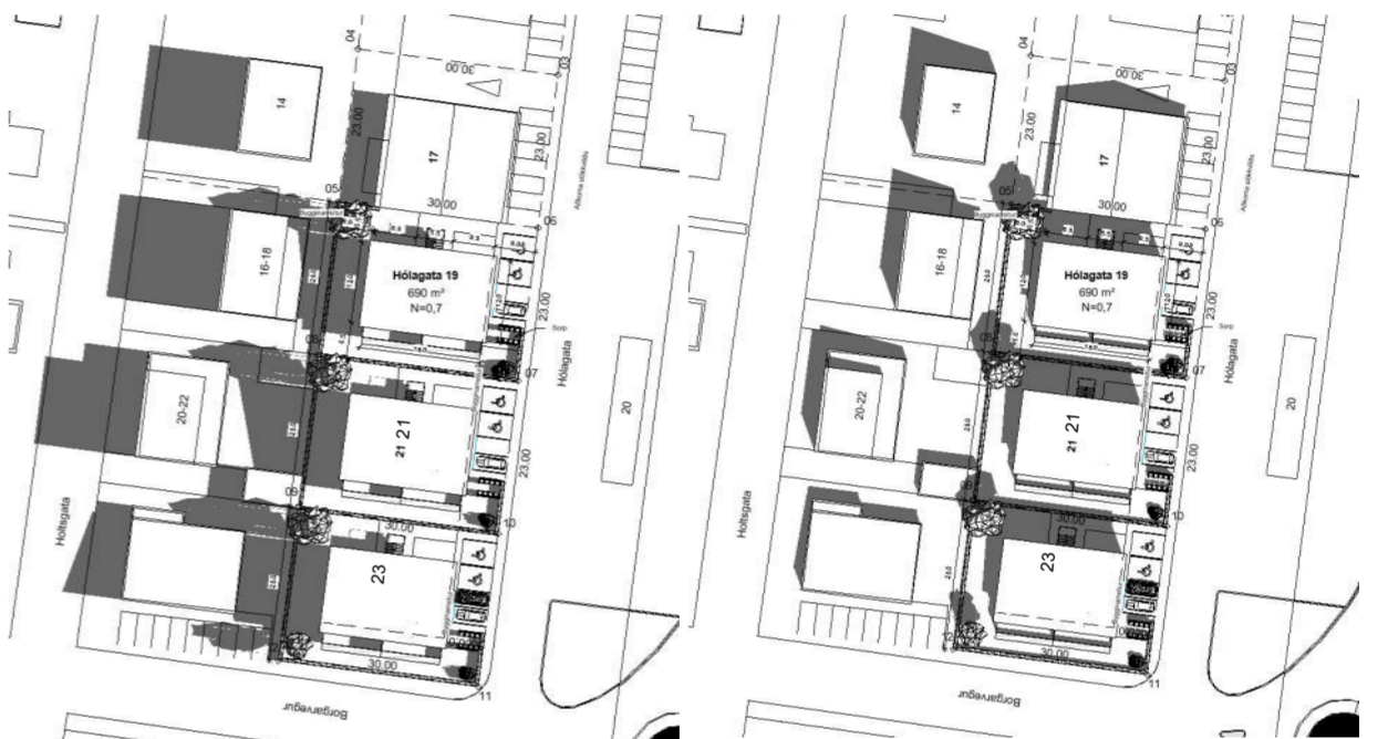
Skuggi 20.06 kl 8:00