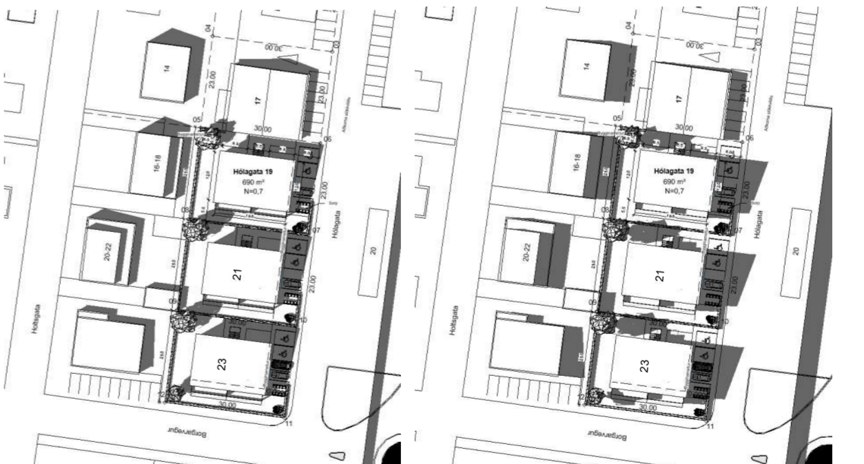
Skuggi 20.06 kl 14:00