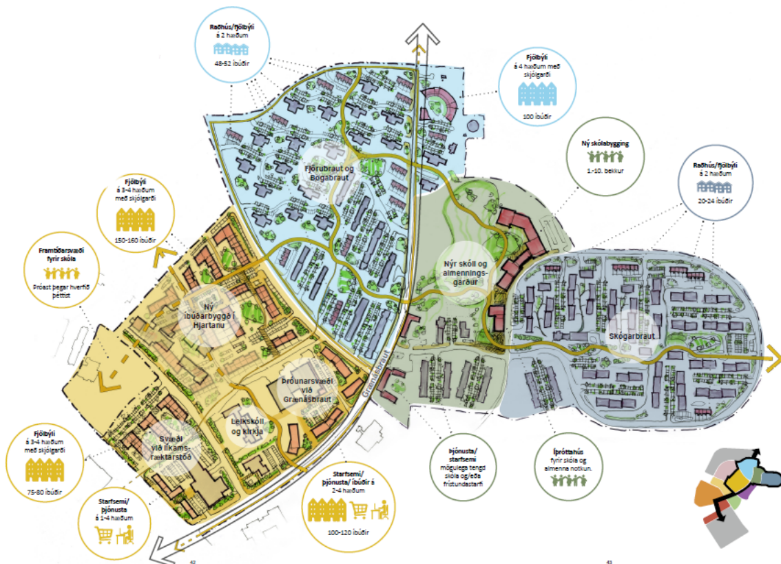
Mynd 4: Hér má sjá uppdrátt af mögulegri þróun á forgangssvæði Ásbrúar með hugsanlegum nýjum byggingum í bleikum lit. Sýnt er gróft mat á mögulegri fjölgun íbúða, þjónustu og atvinnuhúsnæðis á svæðinu.

Deiliskipulagssvæðið er hluti af hjarta Ásbrúar (gulur litur á mynd að neðan) þar sem gert er ráð fyrir aukinni íbúðarbyggð innan um núverandi þjónustu og lifandi starfsemi við Grænásbraut. Mikilvægt er að huga að samhengi við aðliggjandi byggð til þess að tryggja heildaryfirbragð byggðar í hjarta Ásbrúar. Þá er sérstaklega mikilvægt að huga að helstu tengingum fyrir gangandi og akandi.