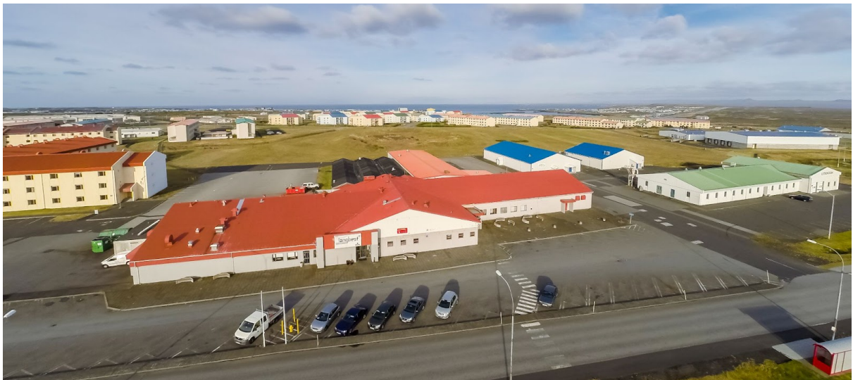
Mynd 2: Horft að deiliskipulagssvæði úr suðvestri, í forgrunni er veitingastaðurinn Langbest.

Deiliskipulagið fellur ekki undir lög um umhverfismat áætlna nr. 105/2006. Í deiliskipulagi verður gert grein fyrir mögulegum áhrifum á umhverfið í samræmi við 12. gr. skipulagslaga nr 123/2010.