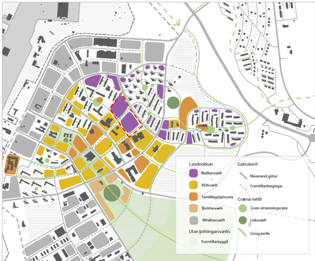
Mynd 3: Rammaskipulag Ásbrúar. Kort sýnir afmörkun deiliskipulags (rauð brotalína) og fyriráætlanir fyrir aðliggjandi byggð skv. rammaskipulagi Ásbrúar.

Frá því að bandaríski herinn fór af landi brott haustið 2006, hefur Ásbrú þróast frá því að vera yfirgefin varnarstöð í mikilvægan bæjarhluta þar sem fjöldi fólks býr, starfar og nemur. Það er áskorun að móta rótgróið hverfi á svæði sem var yfirgefið af fyrri ábúendum og samfélagið á Ásbrú er enn að slíta barnsskónum. Á sama tíma felast gríðarleg tækifæri í staðsetningu svæðisins í nálægð við flugvöllinn, höfuðborgarsvæðið og rótgróið samfélag Reykjanesbæjar.