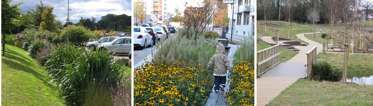
Mynd 6-8: Fordæmismyndir fyrir blágrænar ofanvatnslausnir.

gróðri á þróunarsvæði og meðfram Suðurbraut. Norska verkfræðistofan COWI hefur unnið stefnumótun (e. stormwater masterplan) fyrir ofanvatnskerfið á Ásbrú en þörf er á nánari útfærslu innan hvernar lóðar. Í deiliskipulagi er gert ráð fyrir að settir verði skilmálar og hönnunarleiðbeiningar fyrir blágrænar ofanvatnslausnir. Nánari upplýsingar um blágrænar ofanvatnslausnir má nálgast hjá Reykjanesbæ.