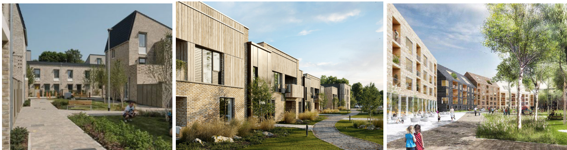
Mynd 5-7: Fordæmismyndir fyrir íbúðarbyggð.