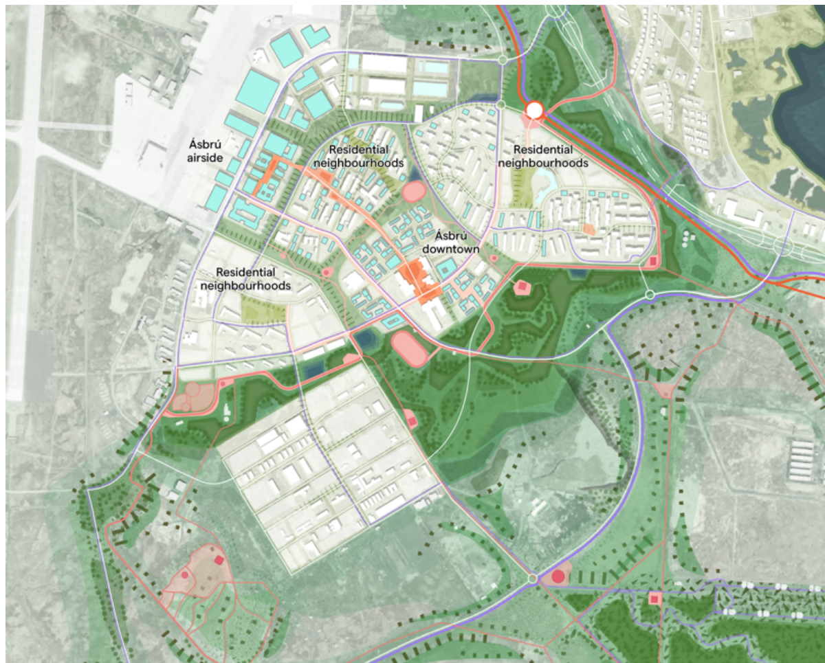
Mynd 9: Yfirlitsmynd af Ásbrú, mynd úr K64, Þróunaráætlun Kadeco 2023.

Framtíðarsýn K64, þróunaráætlunar Kadeco fyrir Ásbrú byggir á samskonar hugmyndafræði og rammaskipulagið. Ásbrú á að njóta góðs af nálægð við flugvallarsvæðið og Reykjanesbæ og gert er ráð fyrir þéttingu byggðar, betri tengingum og meiri þjónustu og starfsemi. Grænir gearar afmarka byggðina og auka skjól. Landslagið á að auka lífsgæði á Ásbrú með því að t.d. auka skjól, móta karakter byggðar, auka gæði almenningsrýma og afmarka ný svæði fyrir samkomur og útivist.