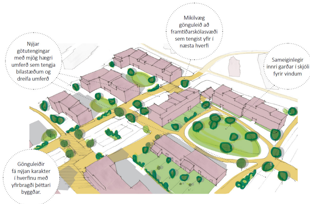
Mynd 8: Hugmynd að byggð á deiliskipulagssvæði skv. rammaskipulagi Ásbrúar.