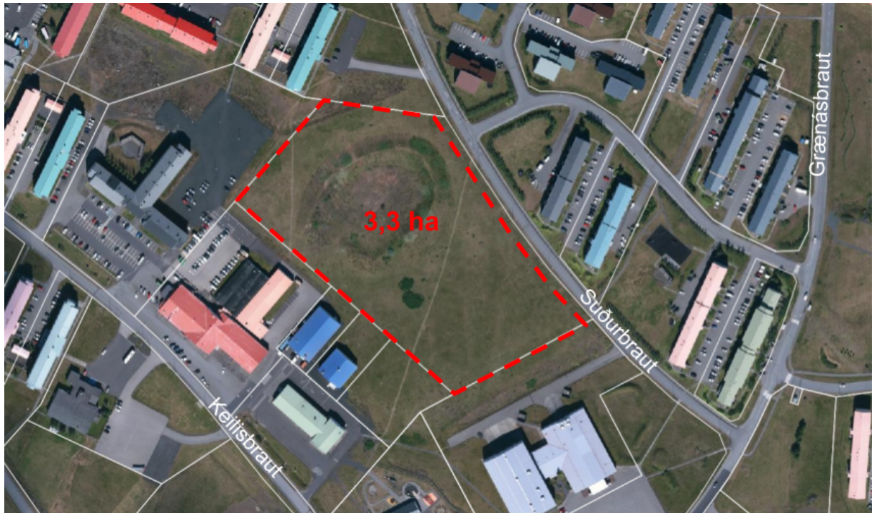
Mynd 1: Mörk deiliskipulagssvæðisins og aðliggjandi lóðamörk.

Deiliskipulagið afmarkast af lóðamörkum við Suðurbraut til austurs og lóðamörkum aðliggjandi lóða og er svæðið um 3,3 ha að stærð. Deiliskipulagssvæðið er miðsvæðis á Ásbrú og þess vegna er mikilvægt að huga að samhengi við aðliggjandi byggð til þess að vel takist til við að móta hjarta Ásbrúar.