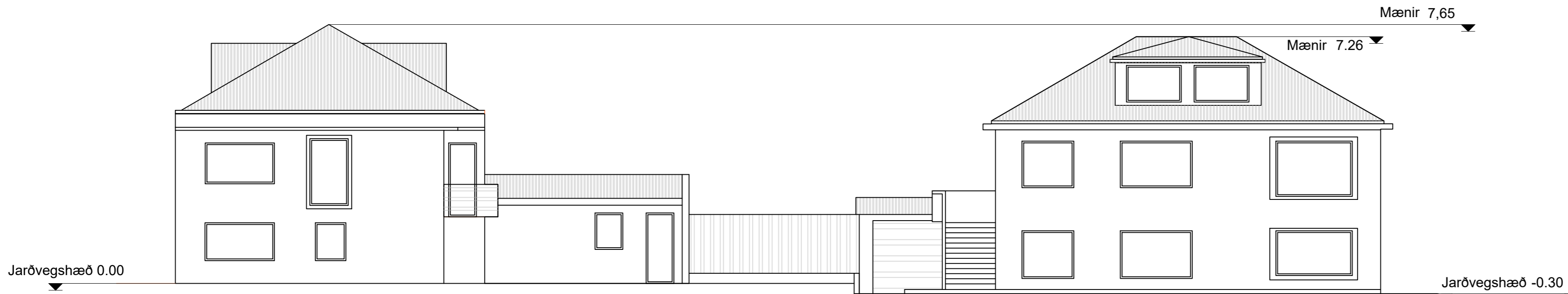
Útlit vestur Eftir breytingar