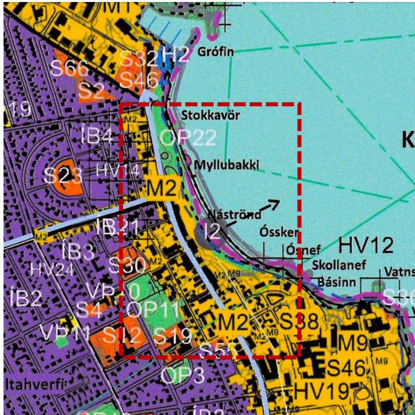
MYND 4 Landnotkun samkvæmt Aðalskipulagi Reykjanesbæjar 2020-2035.