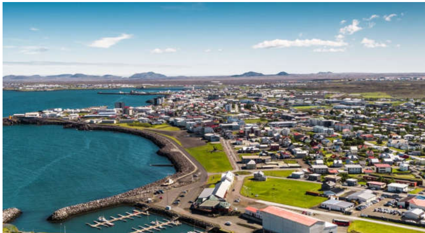
MYND 2 Horft yfir svæðið til suðurs.

Skipulagssvæðið er u.þ.b. 7.5 ha að stærð og afmarkast af Hafnargötu frá gatnamótum Skólavegar til suðurs og Vesturgötu til norðurs auk svæðis að Suðurgötu í vestri og Ægisgötu í austri.