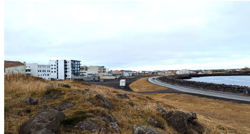
MYND 3 Horft yfir svæðið milli Hafnargötu og Ægisgötu til norðurs.

Þorp byggðist upp í Keflavík á fyrstu áratugum 19. aldar. Það var fyrst og fremst tengt verslun og þjónustu en einnig var stunduð sjómennska og fiskverkun. Hafnargata, sem í upphafi var nefnd Strandgata vegna staðsetningar við sjóinn, myndaðist fyrst sem leið milli landingarstaða báta og varð seinna aðalleiðin í gegnum bæinn. Gatan var lengi helsta verslunar- og bæjargata Keflavíkur og seinna Reykjanesbæjar.