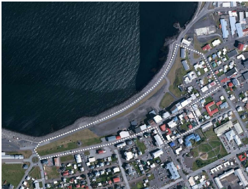
MYND 1 Loftmynd af skipulagssvæðinu, afmörkun svæðisins sýnd með brotalínu.