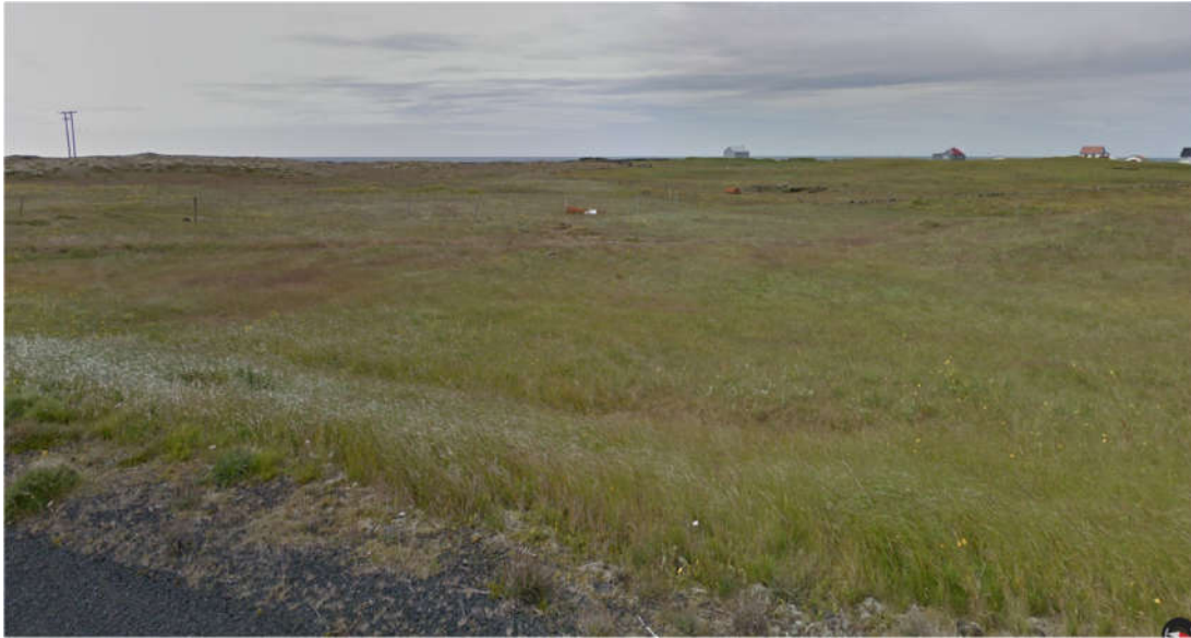
MYND 2. HVAMMUR. SKIPULAGSSVÆÐIÐ.