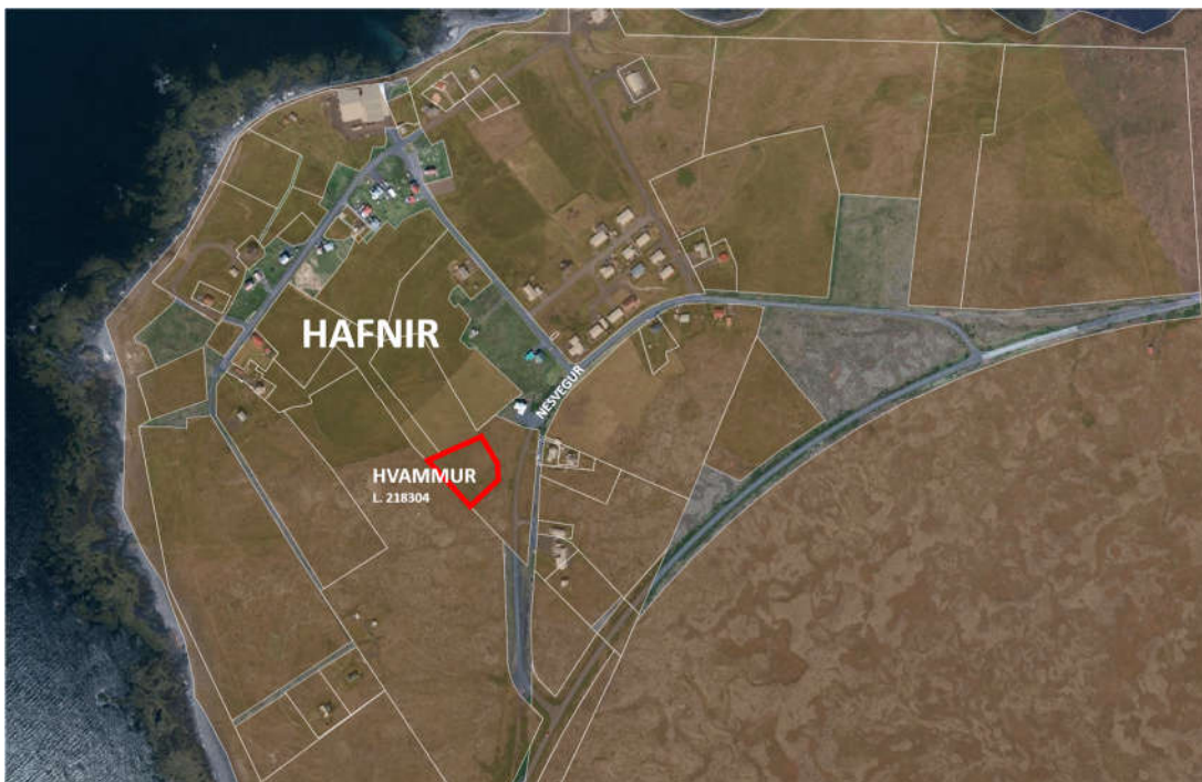
MYND 1. HVAMMUR-REYKJANESBÆ. STAÐSETNING.

Samkvæmt skipulagsreglugerð nr. 90/2013 gr. 6.2 h. eru svæði fyrir frístundabyggð (F) svæði fyrir frístundahús, tvö eða fleiri og nærþjónustu sem þeim tengist, þ.m.t. orlofshús og varanlega staðsett hjólhýsi. Föst búseta er óheimil í frístundabyggðum.