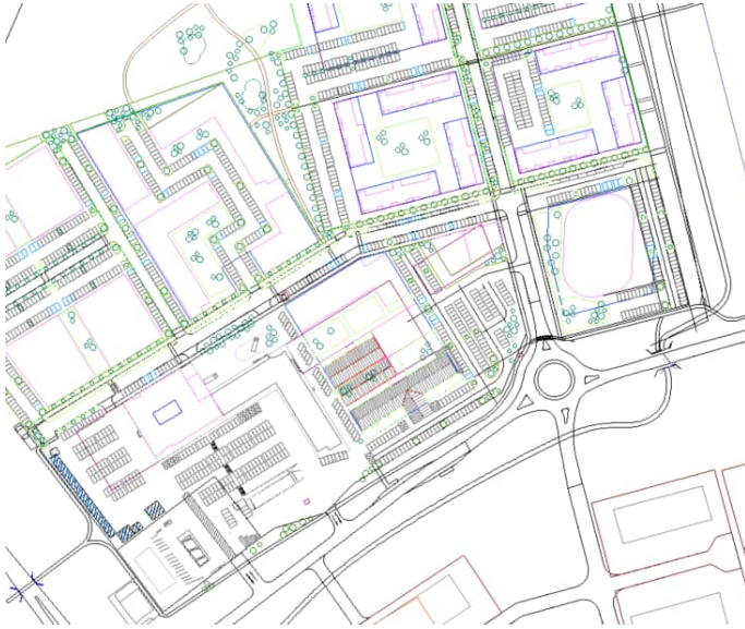
Mynd 2: Deiliskipulagstillaga, mynd frá Arkís

Deiliskipulagstillagan sést á mynd 2. Tillagan g.r.f. að fækka stútum inn á svæðið úr fjórum niður í tvo, auk þess að bæta við hringtorgi á gatnamótum Aðalgötu við Flugvallarveg.