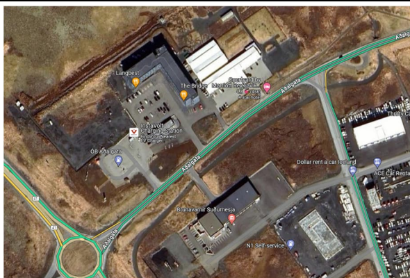
Mynd 3: Umferðarflæði kl.8 og 16 hefðb. aðstæður

Google Maps safnar saman gögnum um umferð á götum. Séu aðstæður á Aðalgötu skoðaðar fyrir hefðbundnar aðstæður er umferðarflæði almennt gott í götunni. Á háannatíma á morgnana og síðdegis er Aðalgata græn og umferð líklegast í frjálsu flæði, það er aðeins rétt við hringtorg út á Reykjanesbraut sem aðeins hægist á umferðarflæði (mynd 3). Í hádeginu virðist þó aðeins hægjast á umferð í Aðalgötu (mynd 4), ekki er vitað hvers vegna svo sé en umferðarflæðið verður aldrei rautt og því bílar aldrei stöpp í götunni.