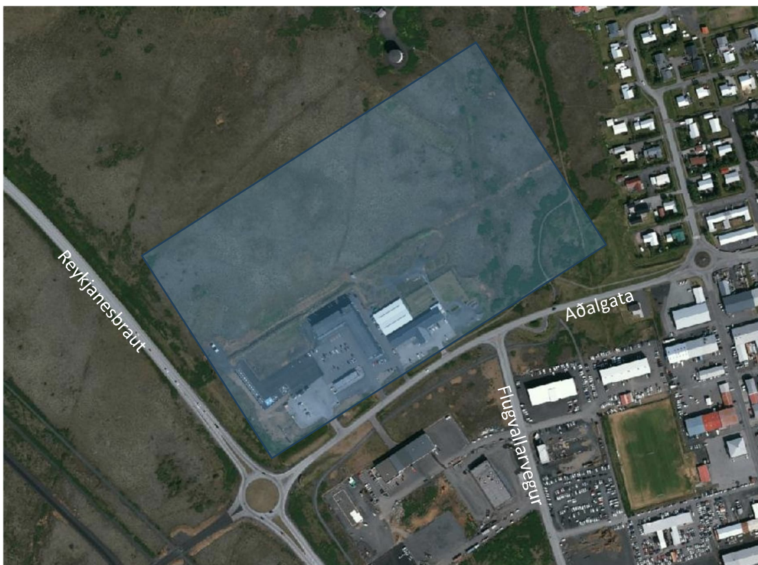
Mynd 1: Loftmynd af núverandi aðstæðum, uppbyggingarsvæði innan bláa reitsins

Hér verður ferðamyndun að skipulagsreit áætluð m.v. skipulagstölur og áhrif á umferð í Aðalgötu metin.