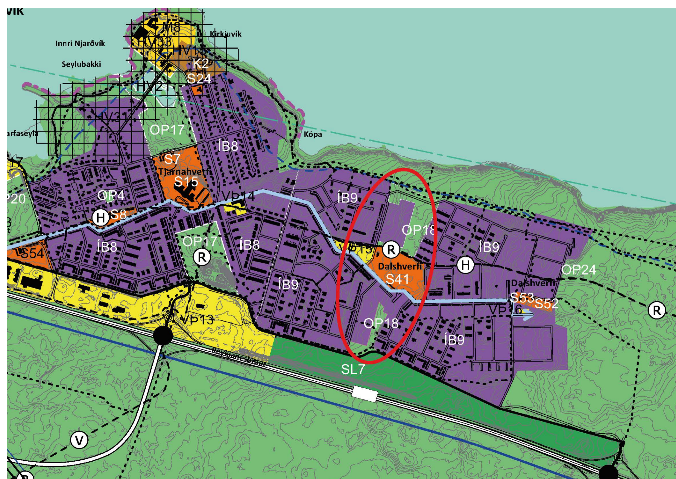
TILLAGA AÐ BREYTINGU Á AÐALSKIPULAGI REYKJANESBÆJAR 2020 - 2035 ÞÉTTBYLISUPPRÁTTUR DAGS. 03.06.2024 mvk. 1:10 000