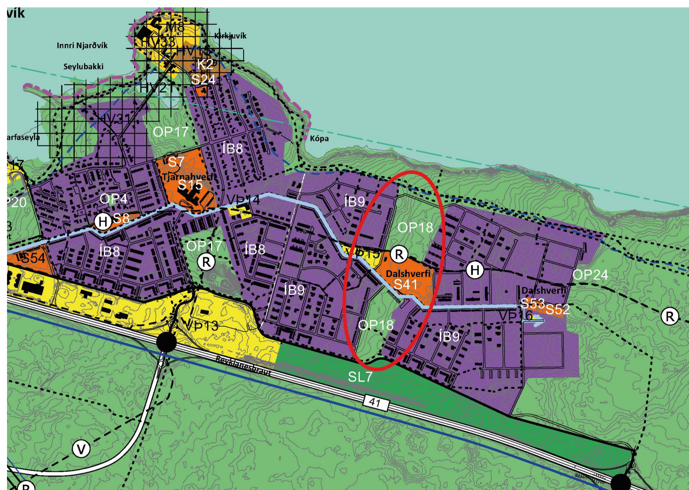
GILDANDI AÐALSKIPULAG REYKJANESBÆJAR 2020 - 2035 ÞÉTTBYLISUPPRÁTTUR STAÐF. 25.01.2023 mvk. 1:10 000