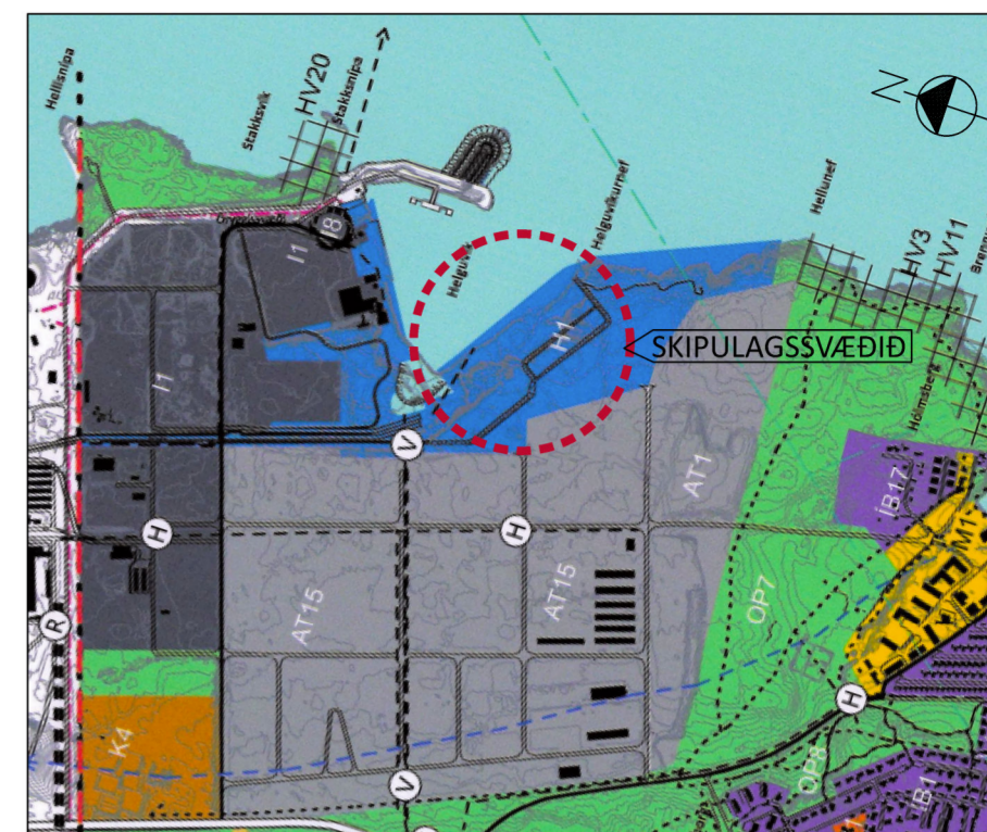
Aðalskipulag Reykjanesháttar 2020-2035