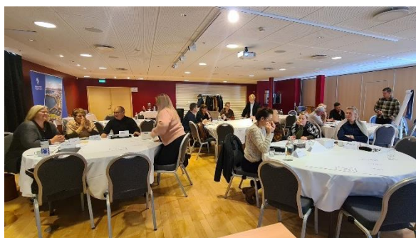
Mynd 2. Frá vinnustofu um 7 venjur til árangurs.

Í framhaldi af vinnustofum framkvæmdastjórnar voru haldnar vinnustofur, byggðar á sama grunni, fyrir starfsfólk fræðsluskrifstofu og skrifstofu velferðarsviðs. Markmið þess námskeiðs var að rækta frumkvæði, sjálfstæði og ábyrgð í starfi og þannig auka starfsánægju og traust á vinnustað. Um var að ræða þrjár vinnustofur þar sem unnið var út frá 7 VENJUM TIL ÁRANGURS. Lögð hefur verið mikil