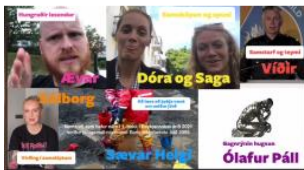
Mynd 3. Fjölbreytt erindi voru á haustráðstefnu fræðsluviðs.

Annað árið í röð héldum við haustráðstefnuna okkar rafrænt. Þar kenndi ýmissa grasa undir yfirheitinu Hvað viljum við gera? Viðfangsefnin voru í takt við áherslur nýrrar menntastefnu og hefur reynslan kennt okkur að þetta fyrirkomulag