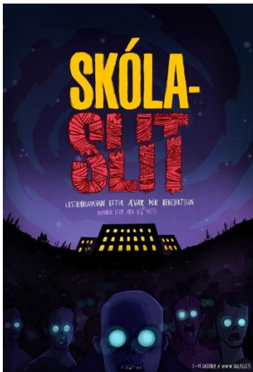
Mynd 6. Læsisverkefnið Skólaslit sló svo sannarlega rækilega í gegn.

Eitt af áhersluverkefnum fræðslusviðs á árinu 2021 var læsisverkefnið Skólaslit. Meginmarkmið með verkefninu var að stuðla að auknum áhuga og bættum árangri í læsi meðal barna í grunnskólum Reykjanesbæjar. Með verkefninu var sjónum meðal annars beint að drengjum og því að auka áhuga þeirra á lestri.