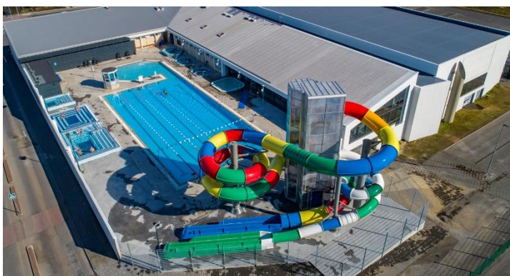
Mynd 8. Nýtt útisvæði Sundmiðstöðvar með rennibraut og setlaugum.

Nýtt og glæsilegt útisvæði í Sundmiðstöðinni var vígt í maí 2021 og hefur það vakið mikla lukku meðal bæjarbúa og gesta. Gestakomur í Sundmiðstöðina jukust um 45% milli árána 2020 og 2021 og má örugglega þakka það að stórum hluta bættari aðstöðu.