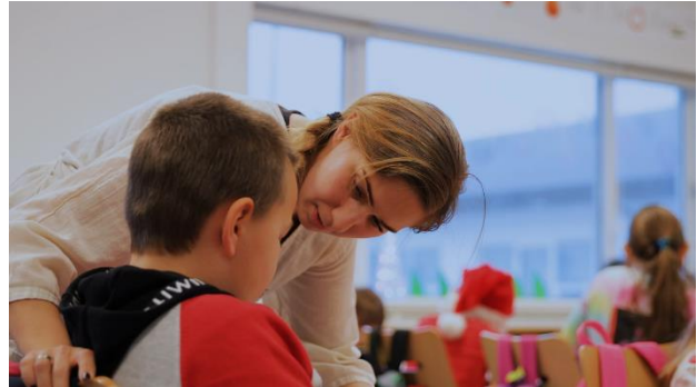
Mynd 4. Auglýsingar í ljósvakamiðlum hafa vakið mikla athygli.

Við höfum lagt mikið upp úr því undanfarin ár að reyna að laða að okkur fagmenntuðu starfsfólki og liður í því hefur verið að birta vandaðar og eftirtektarverðar atvinnuauglýsingar í ljósvaka- og samfélagsmiðlum. Stuðningur við nám með starfi er einnig mikilvæg leið til að efla fagmennsku og fjölga fagmenntuðu starfsfólki og er hún að skila góðum árangri.