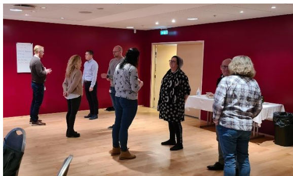
Mynd 1. Frá vinnustofu um 4 lykilhlutverk til árangurs.

Ein af þremur helstu áherslum starfsáætlunar fræðsluskrifstofu fyrir árið 2021 var efling mannaúðs. Sviðsstjóri fræðsluviðs tók þátt, ásamt öðrum lykilstjórnendum í framkvæmdastjórn sveitarfélagsins, í vinnustofunum 4 LYKILHLUTVERK TIL ÁRANGURS. Í vinnustofunum var unnið með viðfangsefnin; grundvallarhæfni öflugra leiðtoga, að skapa traust, að skapa sýn og móta markmið, að framkvæma stefnu og að leysa hæfileika úr læðingi.