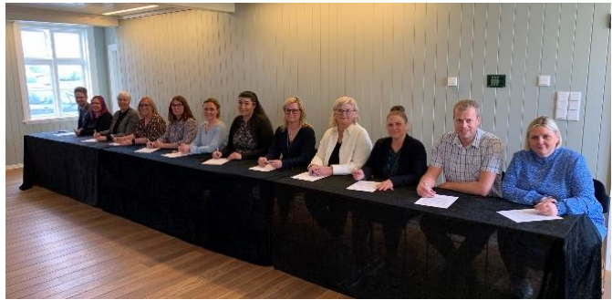
Mynd 6. Frá úthlutun úr Nýsköpunar- og þróunarsjóði fræðslusviðs.

Vorið 2021 var úthlutað í annað sinn úr Nýsköpunar- og þróunarsjóði fræðslusviðs. Markmiðið með sjóðnum er að stuðla að nýsköpun, framþróun og öflugu innra starfi í leik- og grunnskólum í Reykjanesbæ.