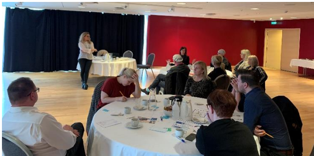
Mynd 5. Stýrihópur menntastefnunnar að störfum.