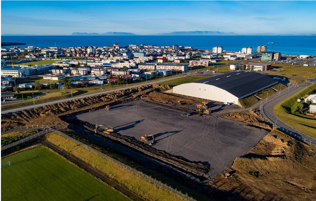
Mynd 2. Framkvæmdir við nýjan gervigrasvöll vestan Reykjaneshallar hafa gengið vel.

Stærstu framkvæmdaverkefni á sviði íþróttá- og tómstundamála á árinu 2020 voru án efa framkvæmdir við nýjan gervigrasvöll vestan Reykjaneshallar og endurnýjun á útisvæði Sundmiðstöðvarinnar sem felur í sér fleiri setlaugar, gufubaðsaðstöðu og nýjar rennibrautir.