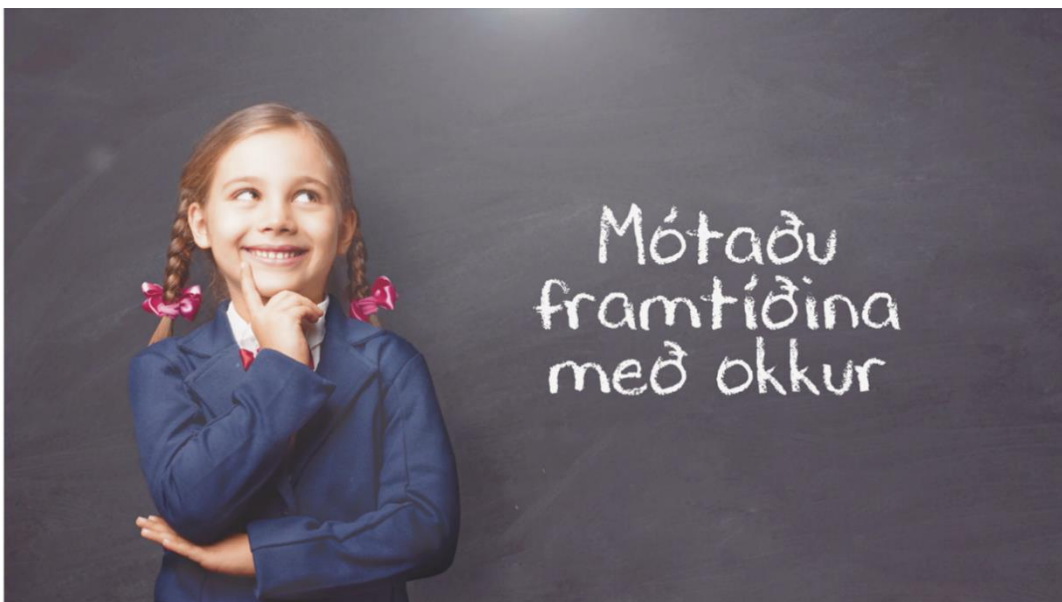
Mynd 4. Auglýst var eftir kennurum á RÚV og samfélagsmiðlunum Facebook og Instagram.

Ein af áherslum í starfsáætlun fræðslusviðs 2020 var að fjölga fagmenntuðu starfsfólki í skólum. Liður í því var að blása til auglýsingarherferðar í miðjum faraldrinum. Við tókum þá ákvörðun að auglýsa ekki í blöðum heldur nýta fjármagnið í aðra miðla, RÚV, Facebook og Instagram. Við fengum birtingu á RÚV á besta tíma, rétt á undan fundum Almannaþingarinnar og öðrum dagskrárliðum sem höfðu mikið áhorf. Þetta skilaði okkur 485 umsóknum um störf í skólunum okkar sem er algjörlega einstakt á okkar mælikvarða.