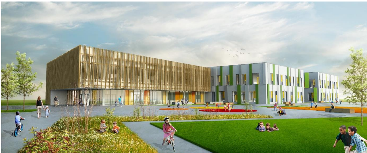
Mynd 1. Stapaskóli, heildstæður skóli fyrir 18 mánaða – 15 ára, hóf starfsemi í nýju skólahúsnæði haustið 2020.

Lang umfangsmesta uppbyggingarverkefnið á fræðsluviðinu árið 2020 var án efa flutningur Stapaskóla í nýtt skólahúsnæði. Það má segja að sú vegferð hafi hafist fyrir um fimm árum síðan eða í byrjun árs 2016 þegar settur var á stofn fjölskipaður stýrihópur til að undirbúa hugmyndafræði og hönnun nýs skóla í Dalshverfi. Við lok vinnu hópsins voru til gögn sem lýstu megináherslum í skólastarfinu og lausleg hugmynd að innra fyrirkomulagi þeirrar byggingar sem nú er risin. Útkoman er þessi glæsilegi og framsækni skóli, þar sem umhverfið og skólabyggingin leika veigamikil hlutverk í því að ýta undir fjölbreytt, merkingarbært og skapandi nám.