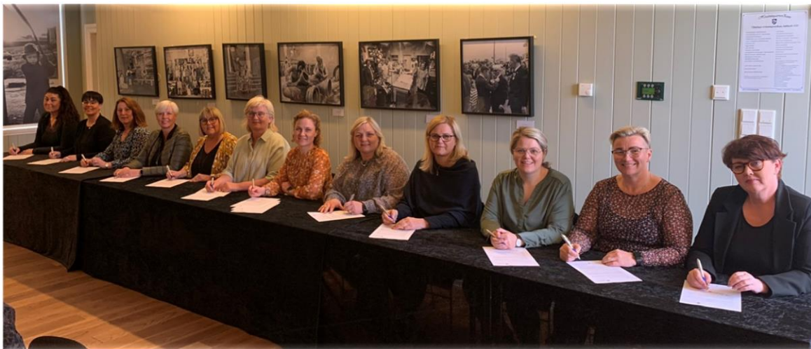
Mynd 5. Fyrsta úthlutun úr Nýsköpunar- og þróunarsjóði fræðsluviðs.

Í apríl 2020 auglýsti fræðsluvið eftir umsóknum í nýstofnaðan nýsköpunar- og þróunarsjóð sem settur var á laggirnar með það að markmiði að stuðla að nýsköpun, framþróun og öflugu innra starfi í leik- og grunnskólum Reykjanesbæjar. Áherslupættir fyrir skólaárið 2020-2021 voru Heilbrigði og velferð, Læsi allra mál og Gæðamenntun fyrir alla . Fjölmargar umsóknir bárust og varð úr að átján fjölbreytt og áhugaverð skólaþróunarverkefni hlutu styrk úr sjóðnum að þessu sinni.