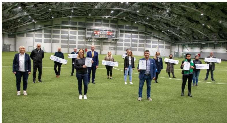
Mynd 3. Frá undirritun samnings um samfélagsverkefnið Allir með!

Allir með er eitt umfangsmesta samfélagsverkefnið sem Reykjanesbær hefur hleypt af stokkunum á undanförunum árum. Verkefnið sem er styrkt af félagsmálaráðuneytinu og Ungmennafélagi Íslands er samstarfsverkefni velferðarsviðs og fræðslusviðs og hefur það að markmiði að stuðla að jöfnum tækifærum allra barna til að tilheyra samfélaginu, að öllum börnum líði vel og að vinátta vaxi í gegnum leik og jákvæð samskipti. Verkefnið er enn fremur unnið í samstarfi við íþróttafélög bæjarins sem hafa komið mjög sterk inn í verkefnið og þá leikur fyrirtækið KVAN einnig stórt hlutverk í verkefninu.